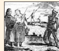
Californios según Shelvocke.

1708-1722. Estancia de piratas como Edward Cooke y George Shelvocke en la región del Cabo.