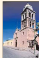
Misión de Nuestra Señora de Loreto.

1705. Establecimiento de la misión de Santa Rosalía Mulegé.