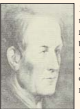
Francisco E. Kino.

1683. Llega a Baja California, en compañía del almirante Isidro de Atondo y Antillón, el padre Eusebio Kino. 1683. Se establece el Real de San Bruno, la primera misión de las Californias, abandonada en 1685.