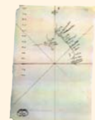
Primer mapa de Baja California, preparado durante la expedición de Cortés.