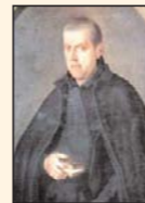
Juan María de Salvatierra.