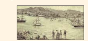
La Paz a principios del siglo xx.

1907. Entra en funcionamiento el Ferrocarril Intercaliforniano, que comunicaba a San Diego con Mexicali, Tecate y Tijuana.