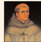
Fray Junípero Serra

1769. Se funda el primer establecimiento franciscano de la península: la misión de San Fernando de Velicatá.