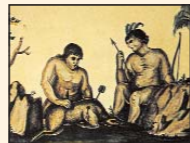
Californios según Ignacio Tirsch, ca. 1768.

1824. Adhesión de la Baja California a la República Federal.