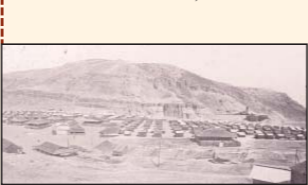
Minas de cobre de El Boleo, en Santa Rosalía, B.C.S.

1936. Comienza el tendido del ferrocarril Sonora-Baja California.