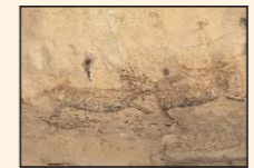
Boca de San Julio.