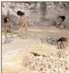
Campamento en Baja California Sur.