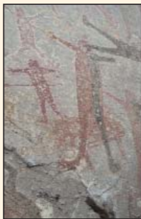
Pintura rupestre, cueva de San Borjitas.

5500 a.C. Esta fecha, la más antigua para la pintura rupestre de Baja California, se obtuvo a partir de una muestra tomada en la cueva de San Borjitas.