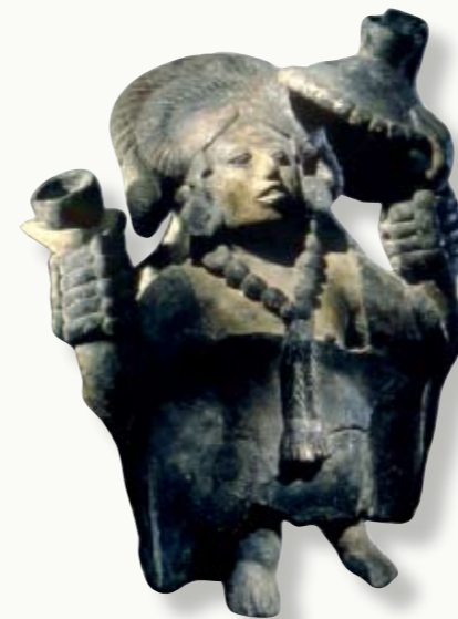
Figurillas de Jaina.