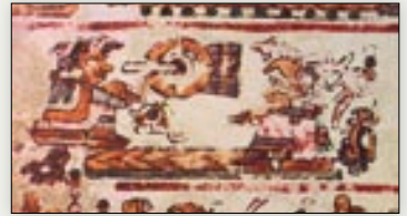
Matrimonio de la señora 1 Muerte y el señor 4 Lagarto. Códice Bodley , p. 1.