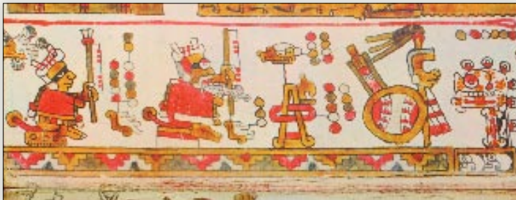
Sacrificio de los herederos del señorío de Jaltepec. Códice Selden , p. 6.