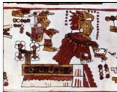
10 Venado y 8 Viento, señores de Suchixtlán. Códice Selden , p. 5.