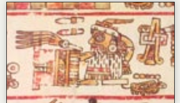
El señor 5 Lagarto recibe vestimentas religiosas. Códice Bodley , p. 7.