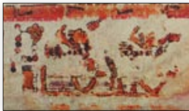
Nacimiento de los señores 13 Flor y 1 Flor en el río de Apoala. Códice Bodley , p. 40.