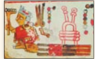
Señor 6 Agua, Quixicayo, como gobernante del señorío de Zaachila. Códice Selden , p. 13.