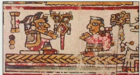
Matrimonio de la señora 3 Movimiento y el señor 8 Serpiente. Códice Bodley , p. 6.