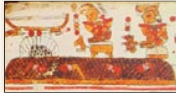
Muerte de los herederos de Jaltepec en Cerro de las Hachas. Códice Selden , p. 12.