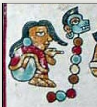
Señora 8 Mono. Códice Vindobonensis , p. 36.