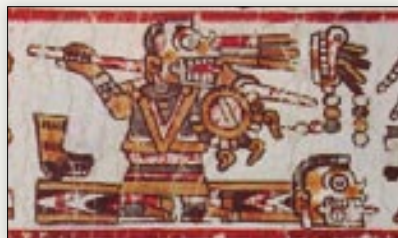
La señora 9 Hierba sobre el glifo de la guerra. Código Bodley , p. 4.