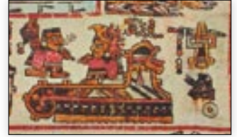
El señor 7 Agua, Águila Roja como gobernante de Cerro del Viento. Códice Bodley , p. 28.