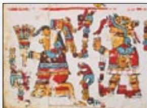
Señora 6 Lagartija, Adorno de Jade. Códice Vindobonensis , p. VI.