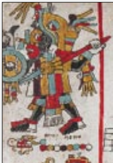
El señor 8 Venado con xicolli de colores. Códice Nuttall , lám. 76.