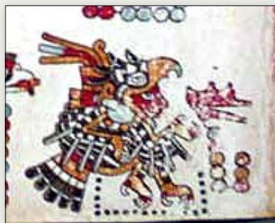
Señor 8 Viento. Códice Vindobonensis , p. 35.