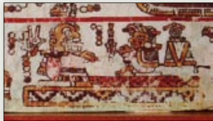
Matrimonio del señor 9 Viento y la señora 5 Caña. Códice Bodley , p. 4.