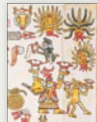
Decapitación de 11 Serpiente, diosa del maguey y del pulque. Códice Vindobonensis , p. 13.