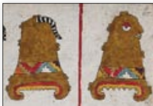
Topónimos del Cerro de la Cola y del Cerro de la Cara. Códice Nuttall , lám. 60.