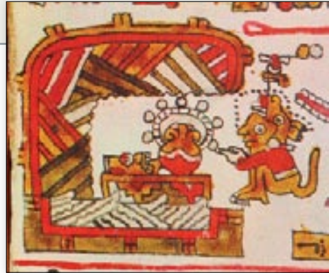
El señor 2 Lluvia, Ocoñaña, coloca en una cueva el corazón de turquesa. Códice Selden , p. 6