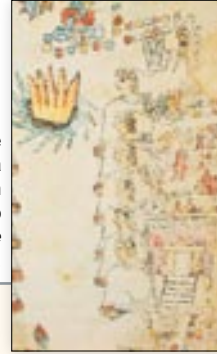
Lista de señores de Teozacoalco. En la parte superior están los señores 8 Conejo y 13 Águila. Códice Tulane , lám. 8.