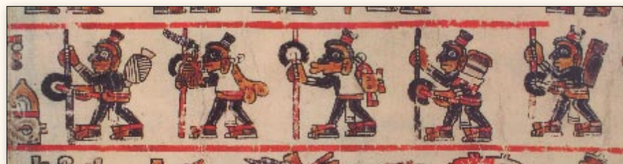
Grupo de viajeros nahuas. Códice Bodley , p. 32.