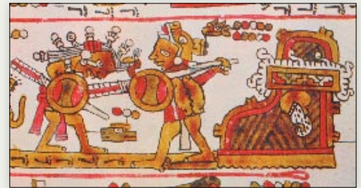
El señor 3 Lagartija, Pelo de Jade ataca el señorío de Jaltepec. Códice Selden , p. 6.