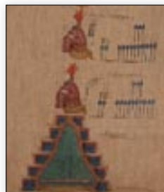
Señores de Zaachila. Lienzo de Guevea .