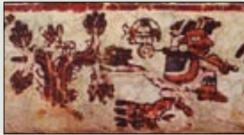
Nacimiento de la señora 1 Muerte. Códice Bodley , p. 1.