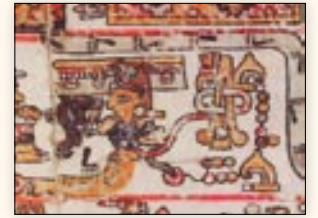
Nacimiento del señor 6 Casa. Códice Bodley , p. 12.