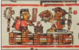
Matrimonio del señor 6 Agua, de Zaachila, con la señora 1 Caña. Códice Bodley , p. 24.