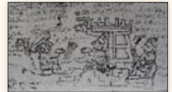
Matrimonio de la señora 4 Hierba y el señor 8 Conejo, Fuego de Tlaxiaco, gobernante de Teozacoalco. Códice Muro , lám. II.