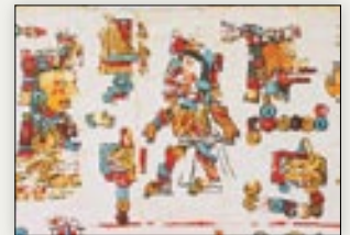
Matrimonio de la señora 5 Caña y el señor 9 Viento, Cráneo de Piedra. Códice Vindobonensis , p. IV.