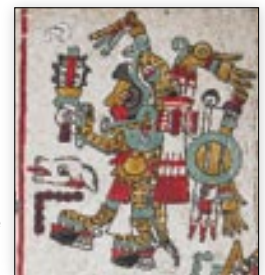
12 caña, año de nacimiento de 8 Venado. Códice Nuttall , lám. 43.