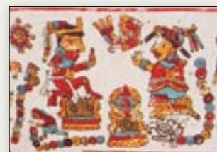
Matrimonio del señor 12 Lagartija y la señora 12 Zopilote. Código Vindobonensis , p. III.