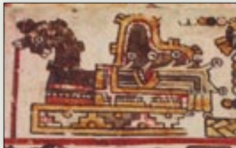
Lugar de origen del señor 5 Lagarto. Códice Bodley , p. 6.