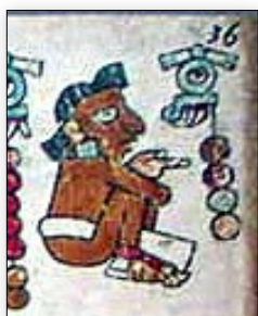
Señor 4 Lluvia. Códice Vindobonensis , p. 36.