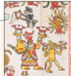
Decapitación de 11 Serpiente, diosa del maguey y del pulque. Códice Vindobonensis , p. 13.