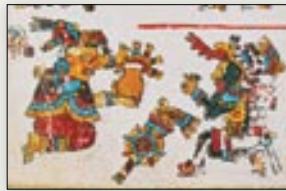
Matrimonio de la señora 1 Muerte y el señor 4 Lagarto, fundadores de Cerro del Sol. Códice Vindobonensis , p. I.