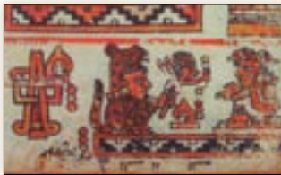
Matrimonio del señor 9 Casa y la señora 3 Conejo. Códice Bodley , p. 17.