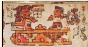
Matrimonio de la señora 6 Hierba y el señor 8 Conejo. Códice Bodley , p. 16.