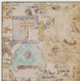
Topónimo de Acatlán, Cerro de la Joya. Códice Tulane , lám 9.