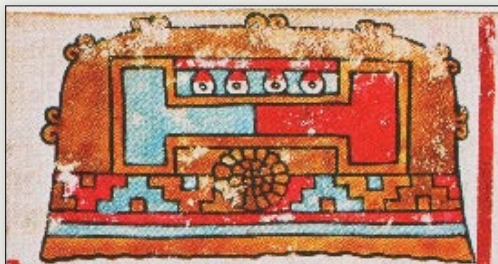
Topónimo del Cerro del Juego de Pelota. Códice Vindobonensis , p. 43.