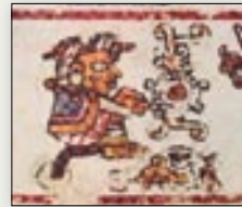
Nacimiento de la señora 1 Zopilote. Códice Bodley , p. 1.