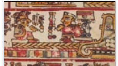
Matrimonio de la señora 2 Hierba y el señor 5 Movimiento. Códice Bodley , p. 6.