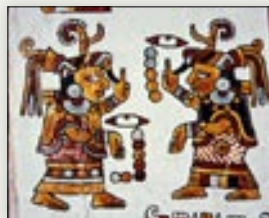
Señoras 7 Pedernal y 5 Pedernal. Códice Vindobonensis , p. 12.