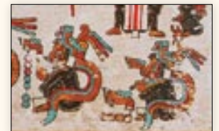
Dioses 7 Serpiente y 4 Serpiente. Códice Vindobonensis , p. 51.