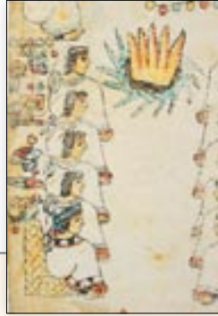
Lista de señores de Teozacoalco. Códice Tulane , lám. 8.