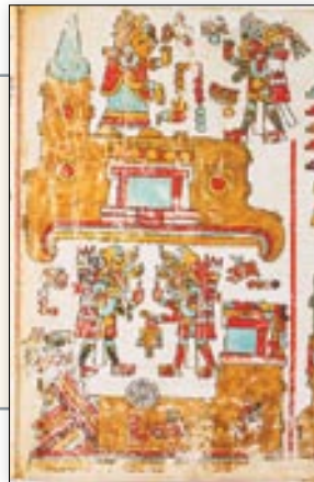
Topónimos de Cerro de la Punta Azul ( arriba ), Peña del Insecto y Valle de la Telaraña ( abajo ). Códice Vindobonensis , p. 2.