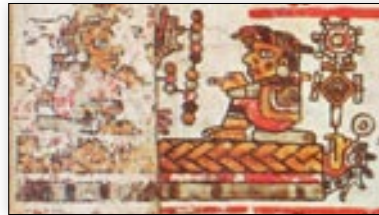
Matrimonio del señor 13 Viento y la señora 1 Águila. Códice Bodley , p. 15.