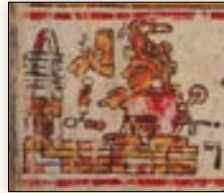
Nacimiento del señor 8 Venado, Yahui, gobernante de Zaachila. Códice Bodley , p. 22.