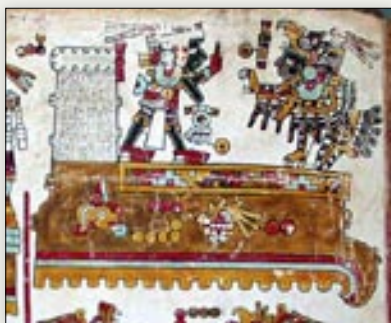
Señores 1 Lluvia y 1 Caña. Códice Vindobonensis , p. 1.