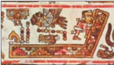
Matrimonio de la señora 12 Casa y el señor 11 Lagarto. Códice Bodley , p. 15.