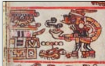
El señor 5 Lagarto entra al templo. Códice Bodley , p. 6.