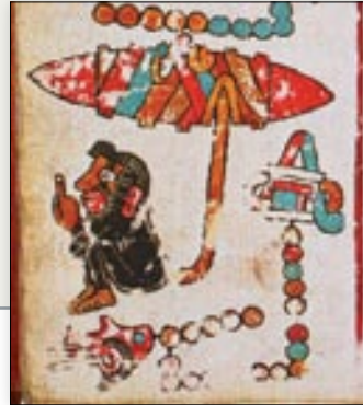
Nacimiento del señor 9 Viento, Quetzalcóatl, de un pedernal. Código Vindobonensis , p. 49.