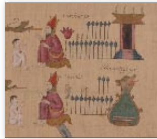
Señores de Zaachila. Lienzo de Guevea.