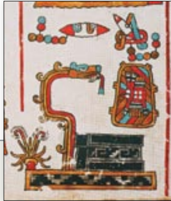
Topónimo de Tilantongo y basamento con serpiente emplumada. Códice Vindobonensis , p. 42.