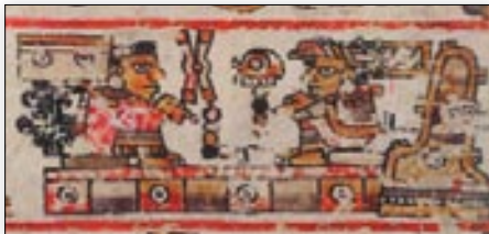
Matrimonio del señor 5 Movimiento y la señora 4 Muerte. Códice Bodley , p. 5.