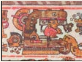
El señor 6 Casa entra a una cueva. Códice Bodley , p. 11.