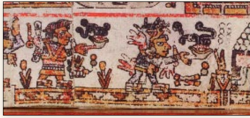
Los hijos de 8 Venado en Cholula. Códice Bodley , p. 12.