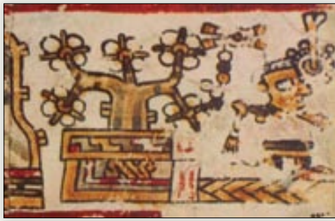
Señor 6 Movimiento, heredero de Suchixtlán. Códice Bodley , p. 6.