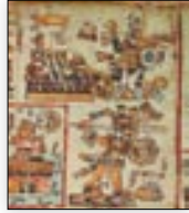
El señor 13 Águila ataca el señorío de Tlaxiaco. Códice Bodley , p. 28.