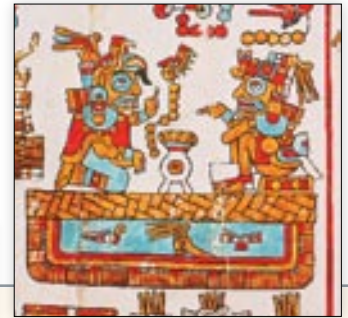
Matrimonio de la señora 9 Lagarto y el señor 5 Viento, fundadores del señorío de Apoala. Códice Vindobonensis , p. 35.