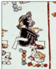
Señor 10 Jaguar. Códice Vindobonensis , p. 37.