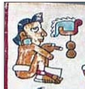
Señor 2 Agua. Códice Vindobonensis , p. 36.