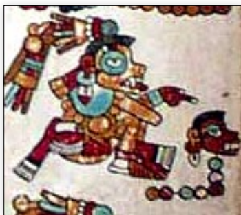
Señor 7 Mono. Códice Vindobonensis , p. 36.