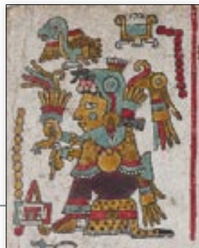
Señora 11 Agua, Pájaro Azul, madre de 8 Venado. Códice Nuttall , lám. 42.