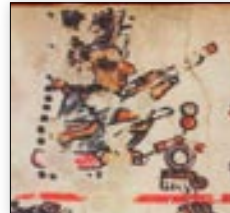
Muerte del señor 2 Lluvia. Códice Bodley , p. 5.