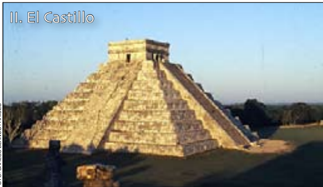
II. El Castillo