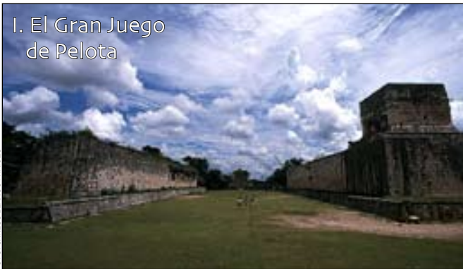
I. El Gran Juego de Pelota