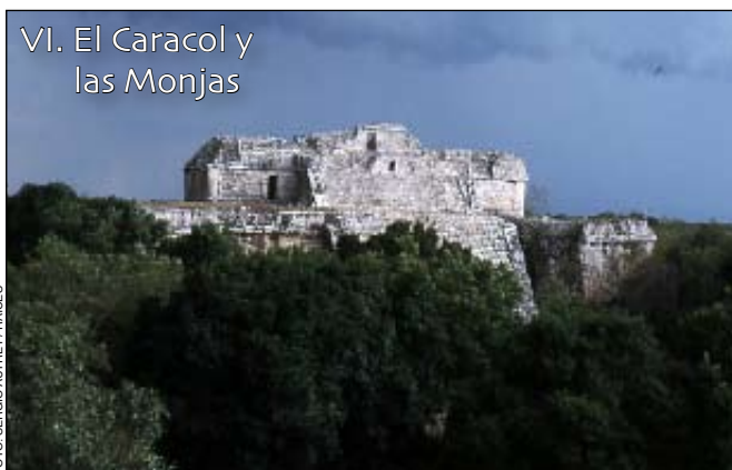
VI. El Caracol y las Monjas