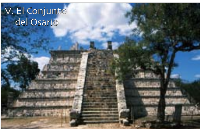
V. El Conjunto del Osario