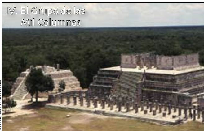
IV. El Grupo de las Mil Columnas